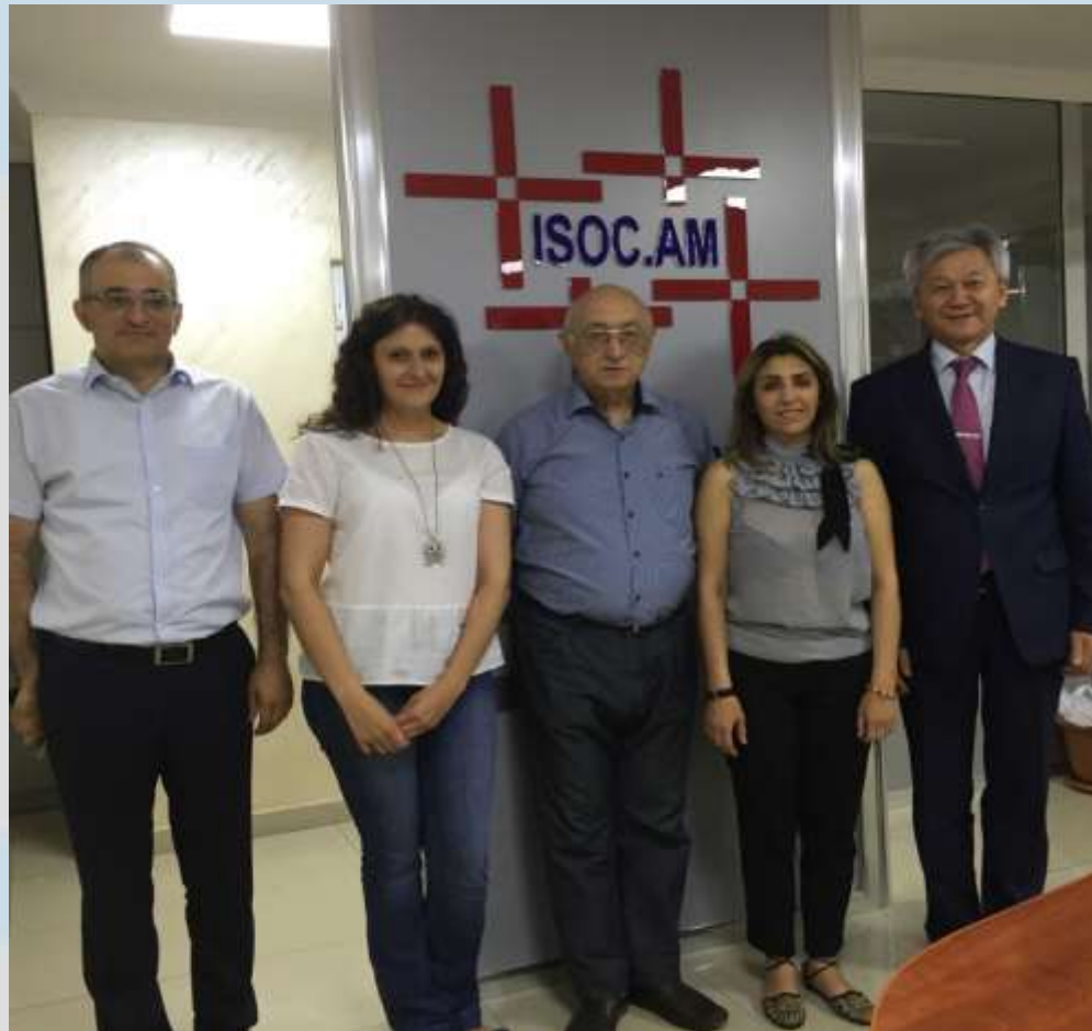
ISOC AM GA, Yerevan