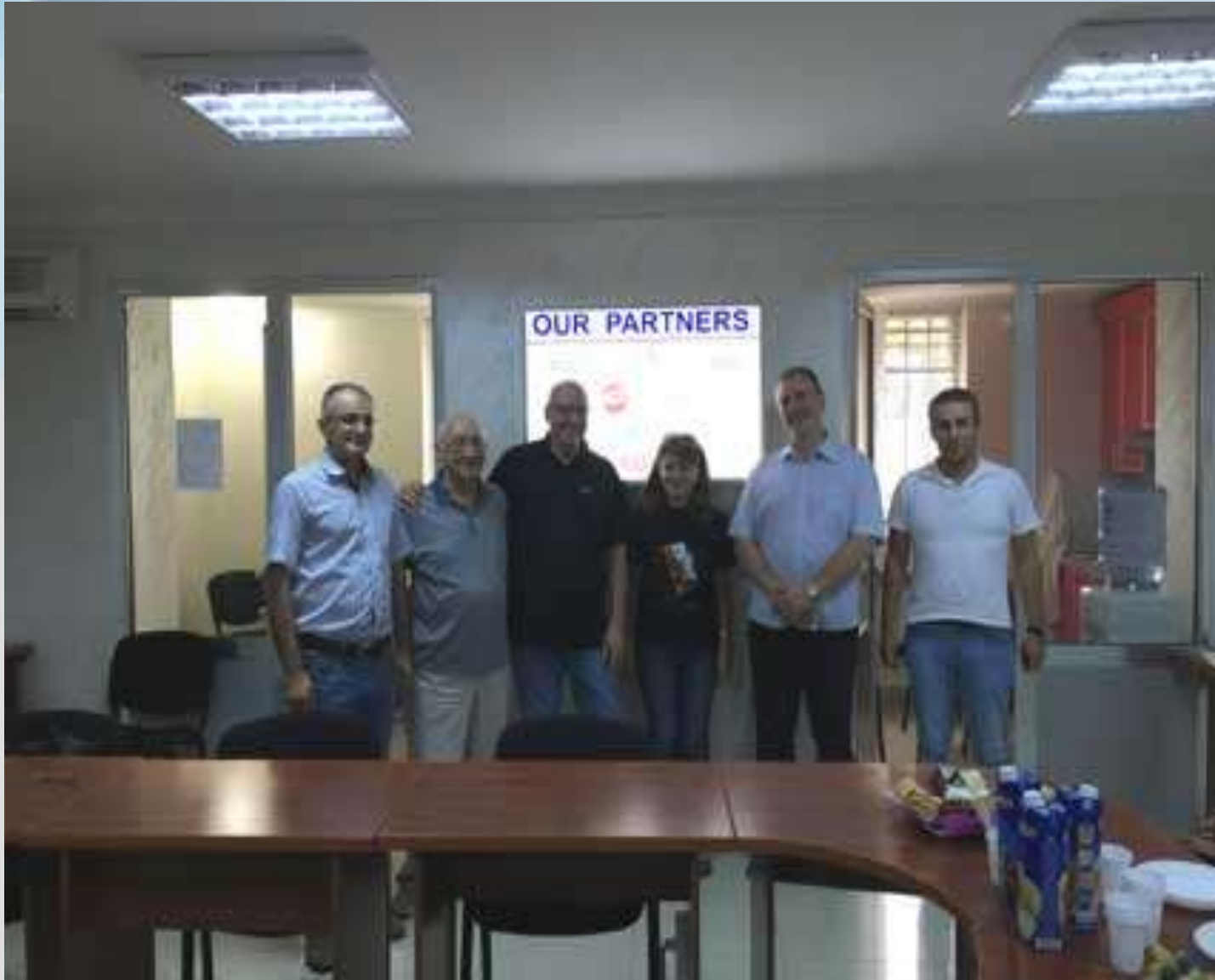
ISOC AM GA, Yerevan, September