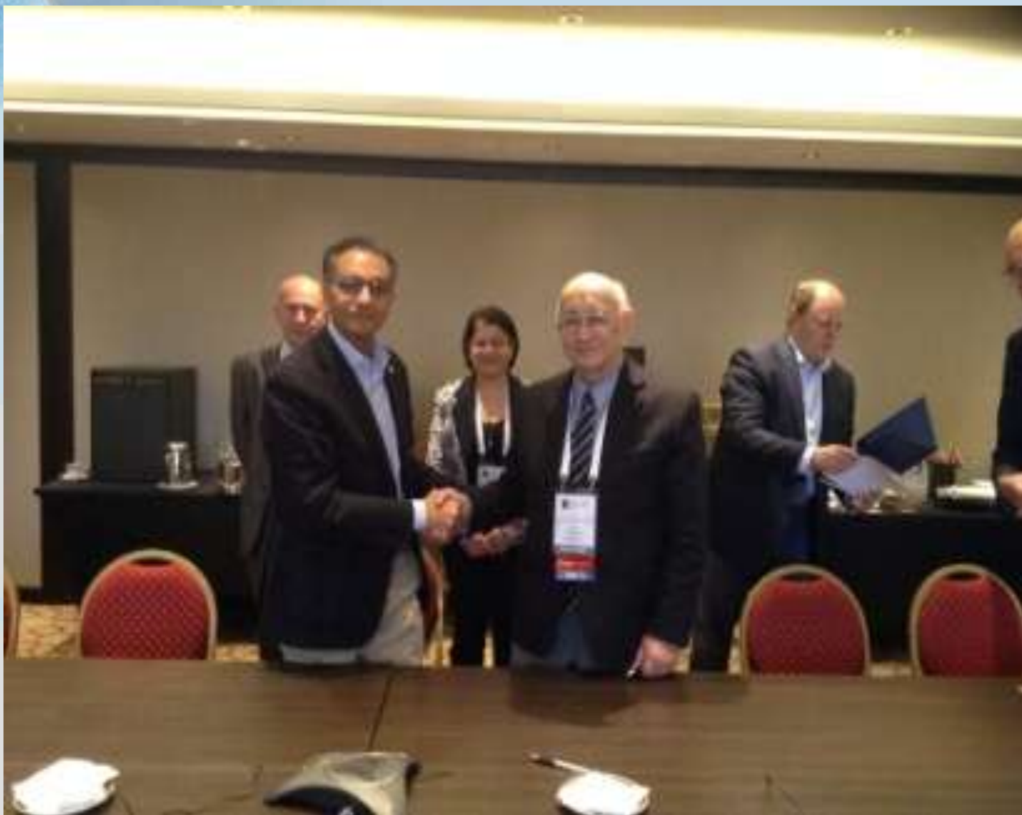
ISOC AM GA, Yerevan